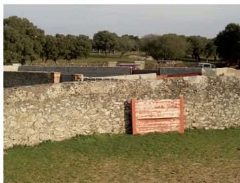
PLAZA TIENTAS (PIEDRA)