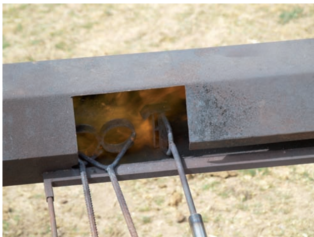
HIERROS EN LA FRAGUA