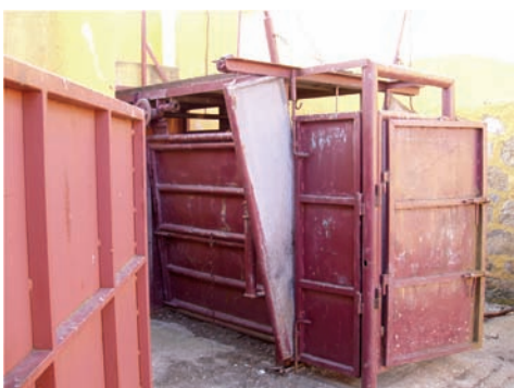
CAJÓN DE CURAS