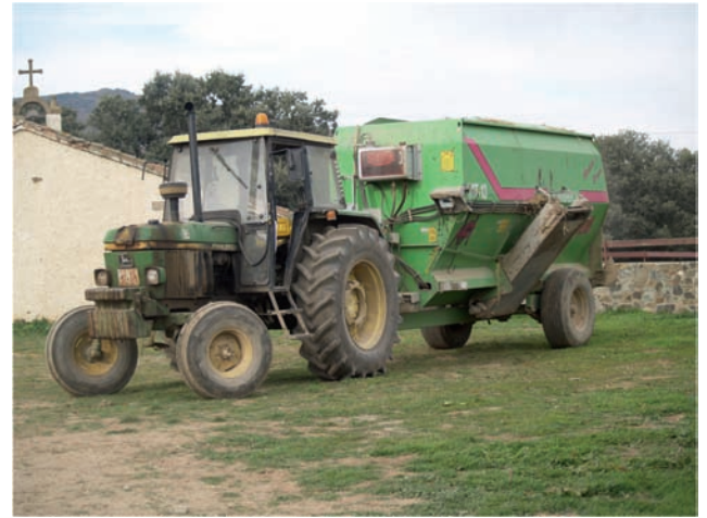
TRACTOR CON CARRO MEZCLADOR