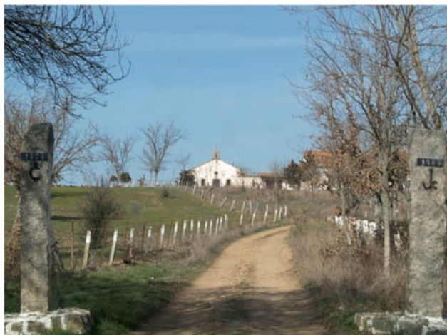
ENTRADA A LA FINCA