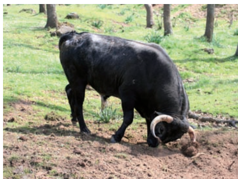
TORNIJAR / ESTORNIJAR