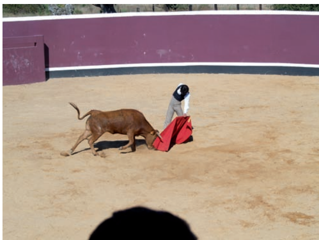
TOREAR DE MULETA