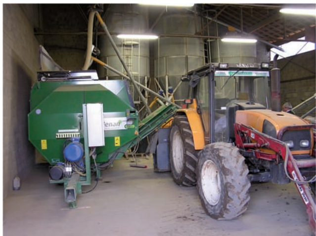
MOLINO Y ALMACÉN