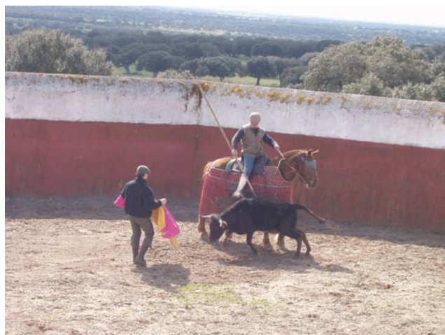
SACAR DEL CABALLO