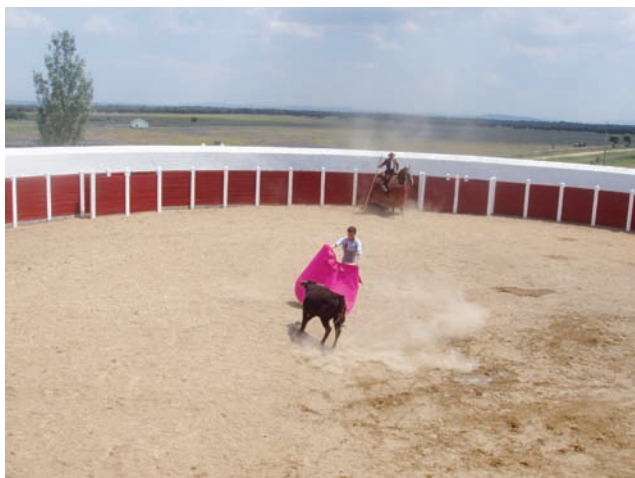
PARAR CON EL CAPOTE