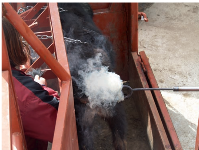
PONER LA MARCA