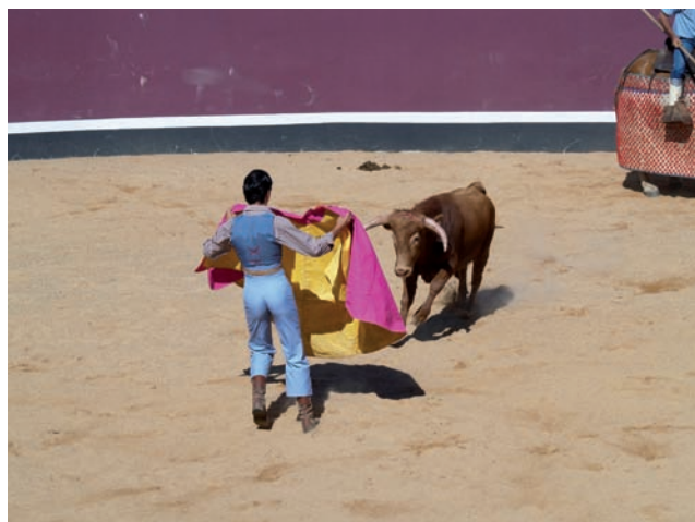
PROBÁNDOLO CON EL CAPOTE