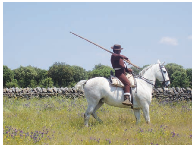
EQUIPAMIENTO DEL MAYORAL