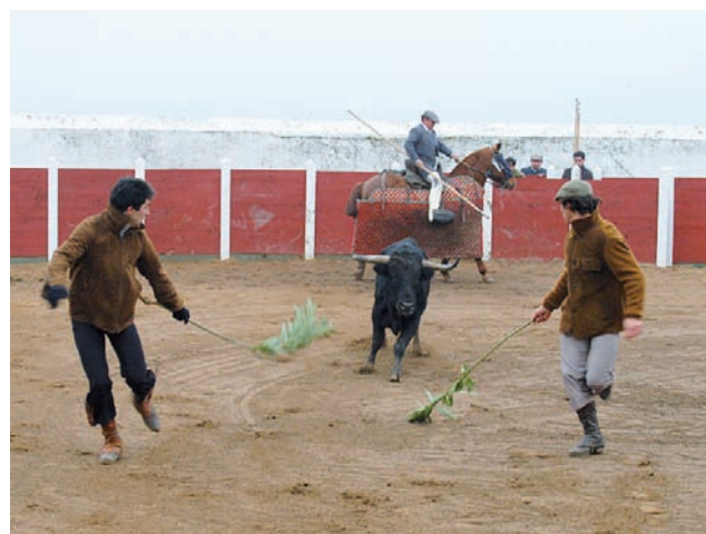
SACAR DEL CABALLO