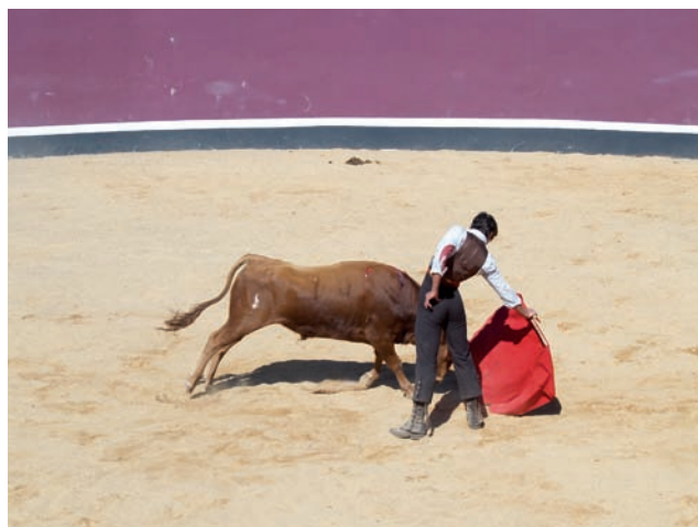
TOREAR DE MULETA