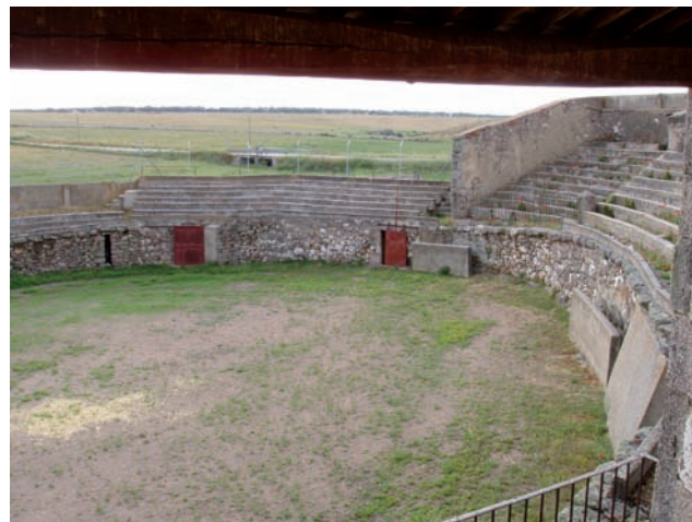
ERMITA Y PLAZA DE TOROS DE LA VIRGEN DE LOS REMEDIOS