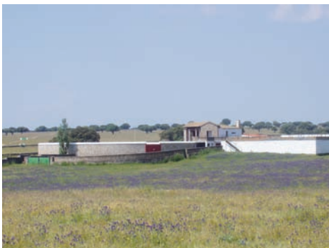
INSTALACIONES: VISTA GENERAL