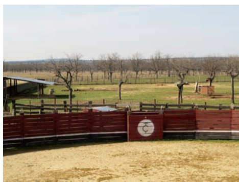
PLAZA TIENTAS (MADERA)