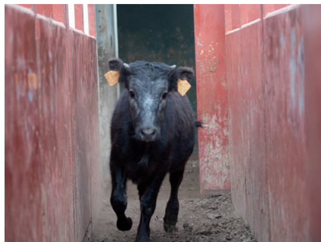
ENTRANDO EN EL CAJÓN